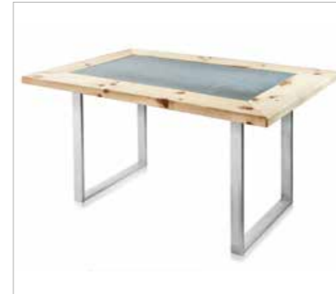
flex 1 für Tische