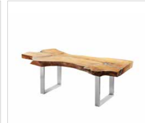
flex 2 für Bänke